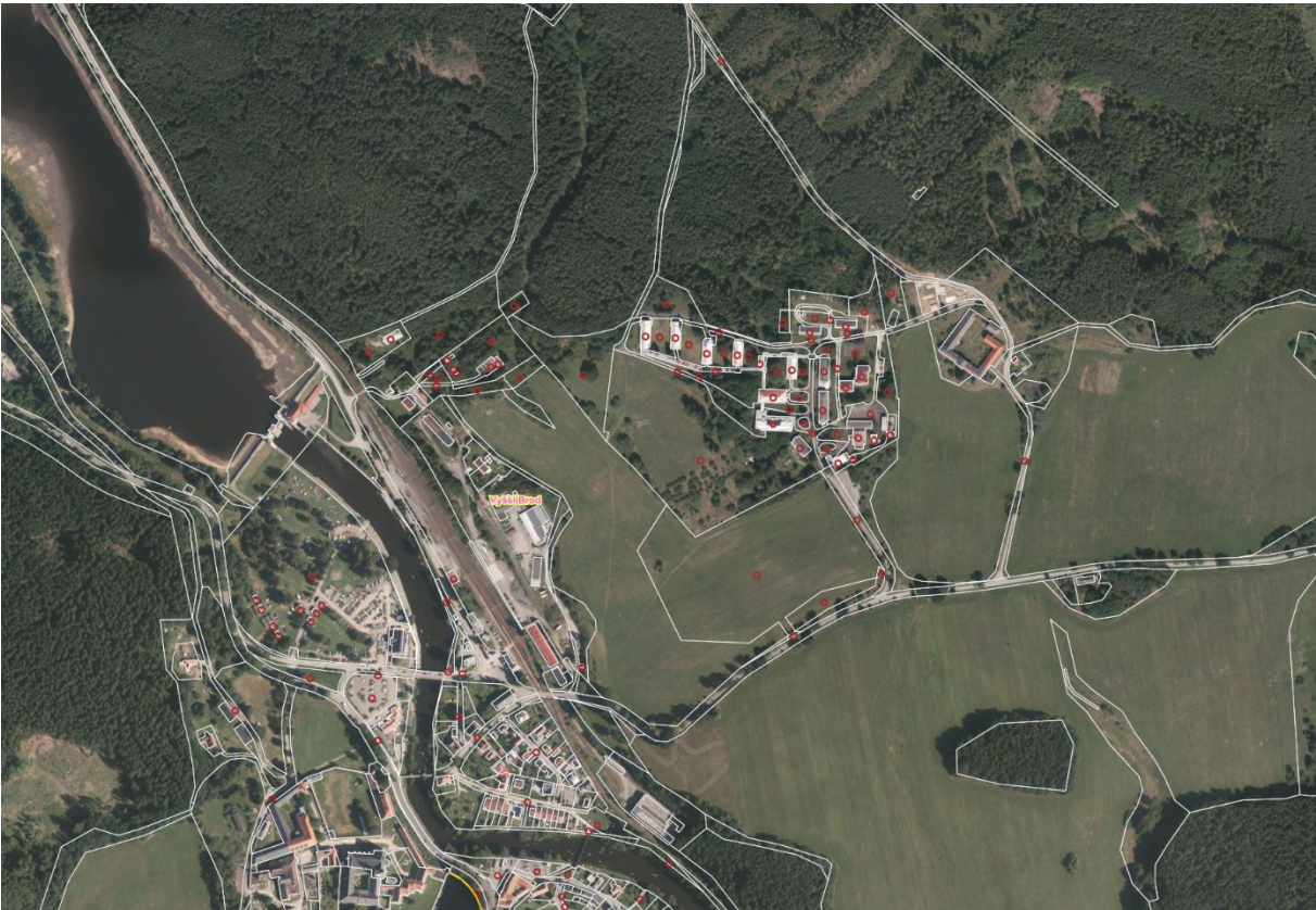
Areál Hrudkov mapa: GIS katastrální území Hrudkov, obec Vyšší Brod