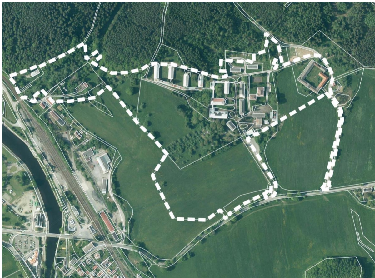
Obrázek 1 _rámcové vymezení dotčeného území v ortofotomapě

Cílem investičního záměru je vytvoření moderního lázeňského areálu, využívající hodnotné přírodní prostředí a klimatické podmínky lokality, při současném respektování urbanistických, krajinářských a environmentálních hodnot území. Součástí ambice města je rovněž ověření existence a případného využití přírodních léčivých zdrojů a navázání na současné trendy lázeňství, relaxace a trávení volného času 21. století.